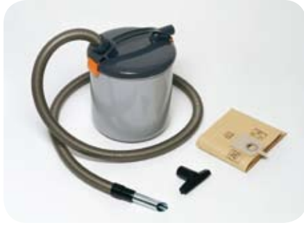
PRESEPARATOR VORABSCHEIDER ESIEROTTELIJA FÖRAVSKILJARE ПРЕДВАРИТЕЛЬНЫЙ СЕПАРАТОР